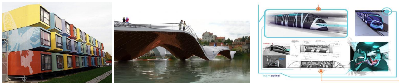
Figura 03: analogias utilizadas, em arquitetura, equipamentos e modos de transporte. 7

algum lugar, o que se pretende pode ser uma variante ou um híbrido de duas coisas já realizadas. Neste momento de busca pela internet a multiplicidade de olhares e visões contribui enormemente. O ambiente virtual permite que todos os meios sejam acionados vale pedir ajuda pelo Facebook ou colocar uma “#hahstag” no Twitter.