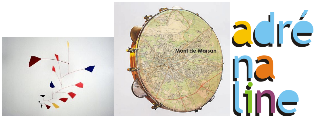
Figura 02: Imagens usadas pelos os conceitos Triskelium, Pandeiro e Adrenalina.

Depois de formulado o conceito, as equipes partiram de Paris para Mont-de-Marsan, com passagem obrigatória por Bordeaux, para uma visita técnica de espaços públicos, culturais e de habitação social. Chegando a Mont-de-Marsan, tudo podia ser observado, percebido e reconhecido ou não. O reconhecimento dos ícones da cidade, monumentos históricos, rios e praças, do nome da apresentação folclórica apresentada na prefeitura para recepcioná-los ou do caminho da prefeitura até a Arena pela Rua Gambetta, parecia corresponder aos dados preliminares estudados. Porém a imersão em um lugar reserva suas surpresas, mesmo ao mais erudito dos visitantes, o ar, o cheiro, as escalas e, sobretudo as pessoas dando sentido a tudo.