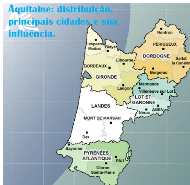
Figura 01 – Localização de Mont-de-Marsan na Região da Aquitânia

Uma cidade pequena e pacata no sudoeste francês, porém com grande potenciais ligados tanto a indústria aeronáutica de alta tecnologia quanto aos inúmeros recursos ambientais e culturais que caracterizam a região. Estes elementos reunidos e somados a possibilidade de integração ao eixo comercial gerada pela implantação da linha de trem de alta velocidade, ligando Bordeaux na França à Bilbao na Espanha, passando por Mont-de-Marsan coloca à cidade uma série de desafios. Guiados por uma discussão sobre acessibilidade e redes urbanas, a cidade se vê na eminência de ser retirada de seu cotidiano tradicional, para ser submetida a uma nova aventura transformadora, que hora ameaça sua harmonia histórica e ambiental e hora lhe convida para participar como ator social na rede das cidades européias integradas por redes de transporte de alta velocidade.