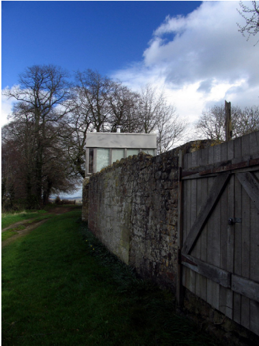
Fotografía 5. Upper Lawn Pavilion, Smithsons

siempre ha sucedido 37 . Esta circunstancia aumenta más aún la responsabilidad que la Universidad tiene.