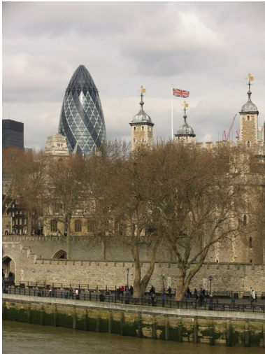
Fotografía 3. Londres

En la actualidad, resulta imposible negar que vivimos envueltos en una realidad que es extremadamente compleja, donde biosfera, socioesfera y tecnoesfera están tan íntimamente relacionados que no podemos descomponer ni sistemas ni procesos en unidades aislables y analizables: vivimos una realidad turbulenta 16 , en la que “ el Capitalismo es seguramente el primer acelerador de turbulencia sistémica ” 17 . Es decir, el Capital –entre otros- y su actuación producen mecanismos de fusión de metrópolis son un modelo ejemplar de lo que es la turbulencia sistémica.