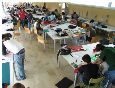
Fotografía 1. Alumnos ETS Valencia, trabajando

Los autores del presente texto somos arquitectos y profesores en una Escuela de Arquitectura pública; ambos quehaceres exigen un comportamiento responsable, autocrítico.