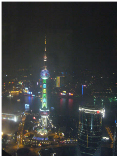
Fotografía 4. Shangai

abordar críticamente el total de la bibliografía existente 24 en un único idioma, sobre cualquier tema que se plantee. 25