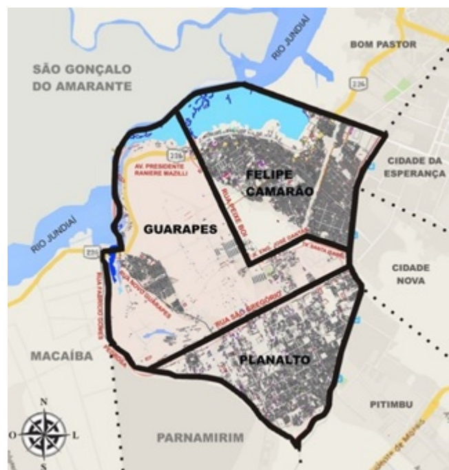
Figura 4. Localização da Rua Novo Guarapes e demais vias que delimitam o bairro

PMN, 2012). Se por um lado, as circunstâncias no modo de ver do observador, neste caso, dizem respeito a frequência de circulação que não abrange tais fronteiras, as características físicas podem auxiliar na demarcação do fim e do início de outra região. O bairro constitui-se delimitado por fronteiras que nem sempre foram apontadas pelos estudantes como limite físico correspondente. Exemplo disso é o Leningrado (antigo assentamento transformado em conjunto habitacional), que não parece ser identificado como porção no Guarapes, sendo apontado como pertencendo a outro bairro, o Planalto.