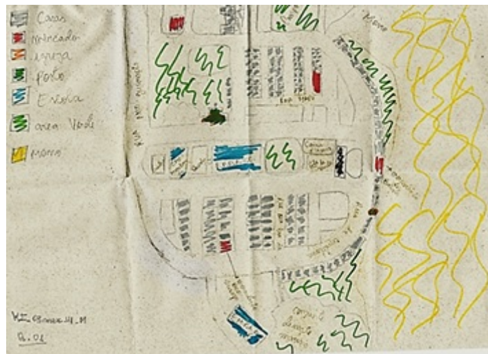
Figura 5. Desenho de mapa - apresentação do bairro (Estudante do turno matutino, masculino, 14 anos)

Quanto às vias, é importante ressaltar que as ruas mais representadas estão situadas em notável proximidade da escola. Semelhante às dificuldades na descrição de vias longas inseridas no espaço da cidade, é possível notar que muitas vias do bairro foram graficamente reduzidas pelos estudantes, como ocorre com a Rua Novo Guarapes (Figura 4) que, embora se estenda até zona limítrofe com outro bairro, tem representação limitada a trechos nas proximidades do ambiente escolar (Figura 5).