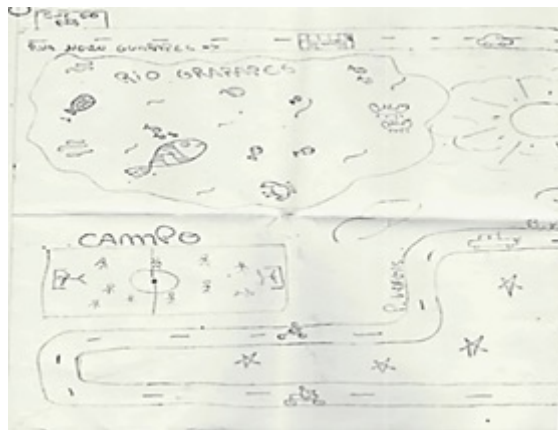
Figura 2. Desenho artístico do bairro: apresentação do bairro (Estudante do turno vespertino, feminino, 15 anos)