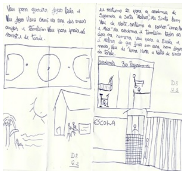
Figura 3. Desenho de situação: final de semana e dia de semana (Estudante do turno vespertino, masculino, 15 anos)