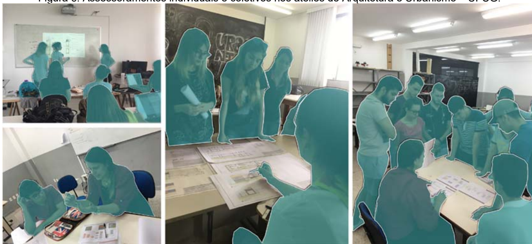
Figura 6: Assessoramentos individuais e coletivos nos ateliês de Arquitetura e Urbanismo – UFCG.

Quanto aos procedimentos didáticos utilizados, foi possível constatar que, em todos os ateliês analisados, a estratégia mais adotada era a do assessoramento, individual ou coletivo (Figura 6). No caso da graduação em Arquitetura e Urbanismo, diferente do curso de Design, percebeu-se que os professores utilizam com bastante frequência o assessoramento coletivo, no qual todos os alunos da turma têm total liberdade de intervir, caso desejem, através de questionamentos, dando dicas ou sugestões para o projeto do colega que está sendo orientado. Na disciplina de PAIII, especificamente, foi possível verificar que o docente também faz uso de exercícios em alguns momentos ao longo do semestre para facilitar o processo de aprendizagem, como, por exemplo, na fase de elaboração de conceitos, estabelecimento de diretrizes projetuais, bem como no processo de avaliação do produto final.