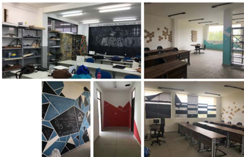
Figura 5: Ateliês analisados no curso de Arquitetura e Urbanismo - UFCG.

No que se refere às condições físicas, também são bem parecidas. Eles possuíam áreas construídas que variavam entre 49m 2 e 60m 2 , sendo seus formatos retangulares ou quadrados. Quanto aos mobiliários, todos os ateliês se encontravam equipados de pranchetas, cadeiras, bancos, lousa, estantes para exposição de trabalhos e armários coletivos. Além disso, os espaços também contavam com projetor multimídia e alguns poucos pontos de instalações elétricas. Excepcionalmente, em uma das salas, cuja disciplina de PAIII estava sendo ministrada, de área aproximada de 155m 2 , verificou-se, além dos mobiliários e equipamentos já mencionados, a existência de algumas máquinas interessantes para os estudos projetuais, quais sejam a máquina de gravação e corte a laser e o túnel de vento. Uma questão importante e que deve ser levada em consideração com relação aos ateliês de Arquitetura e Urbanismo é que, em todos eles, existia a possibilidade de o aluno intervir no espaço, de “se sentir parte”, de expor a sua criatividade de alguma forma (Figura 5).