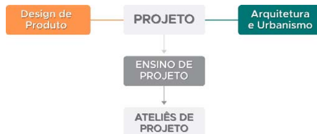
Figura 1: Relação do projeto com o Design e a Arquitetura e Urbanismo.

Diante deste contexto, este artigo, fruto de uma pesquisa de mestrado que foi motivada pela inquietação dos pesquisadores relacionada à caracterização (espaço físico disponibilizado, metodologias e estratégias pedagógicas utilizadas) dos ateliês de projeto considerando o sistema universitário no qual estão inseridos, tem como foco o ensino de projeto nos ateliês de um caso estudado. Para tanto, fez-se necessária a análise de alguns componentes curriculares para que houvesse uma maior aproximação com as questões inerentes à temática. Deste modo, foram selecionadas três disciplinas de projeto do curso de Arquitetura e Urbanismo e mais três do curso de Design, todas ofertadas na Universidade Federal de Campina Grande (UFCG).