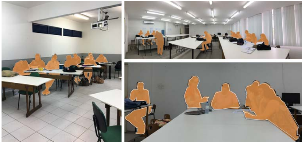
Figura 4: Ateliês analisados no curso de Design - UFCG.