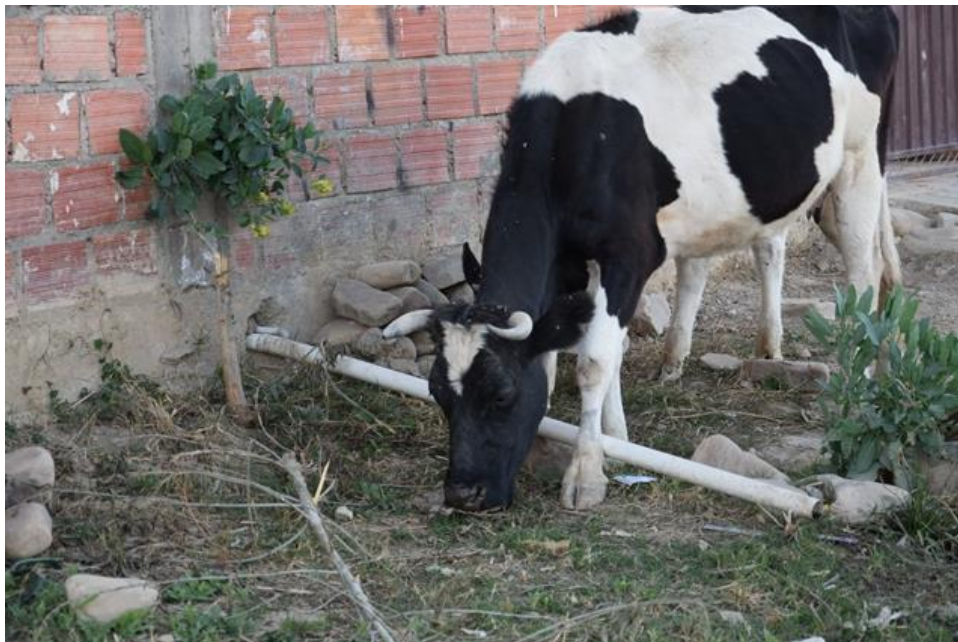
Figura 5: Contaminação ambiental por falta de infraestrutura básica em uma vivienda