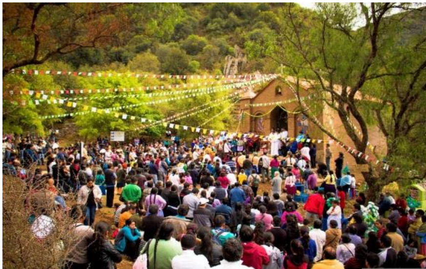
Figura 3: Fiesta tradicional de Lazareto en la capilla antigua de Lazareto