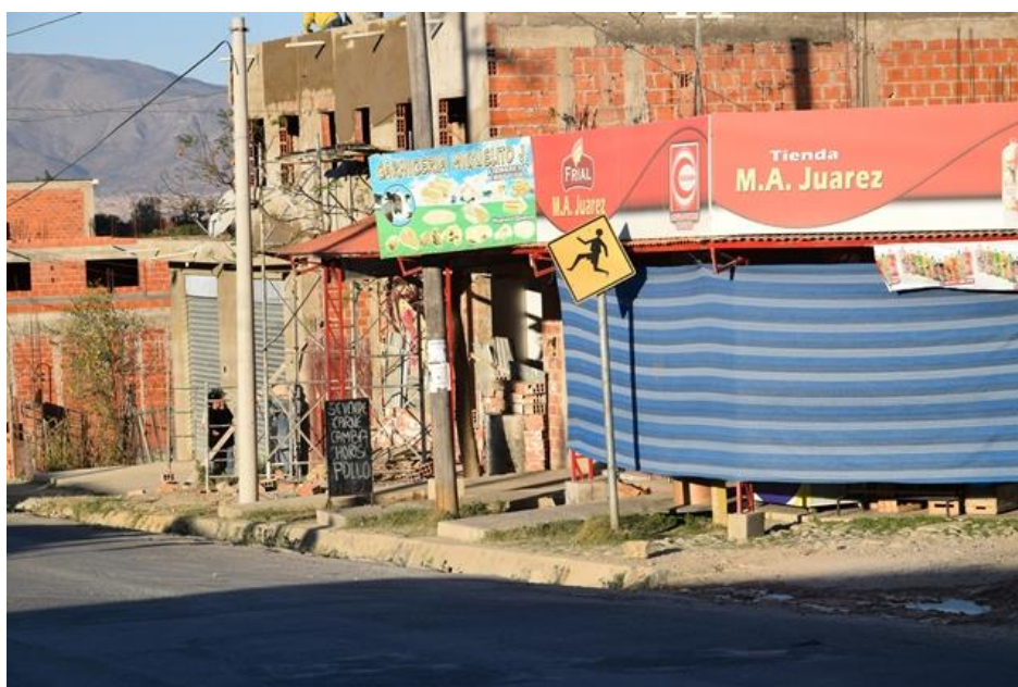
Figura 4: Imagen urbana y paisaje artificial sobre el caminho a Lazareto

tardío. Añadido a ésto, se intuye que el trasfondo que envuelve esta problemática, obedece a la especulación inmobiliaria, un mercado negro de tierras que parece ser el modus operandi adquirido en el que la persona que no construye su casa, no adquiere el derecho a su vivienda. Sucede con frecuencia que muchas de estas construcciones, sólo representan oportunidad de engorde 6 una forma egoísta de ver, construir y vivir en la ciudad, pues sólo obedece a los intereses particulares y no así al bien colectivo.