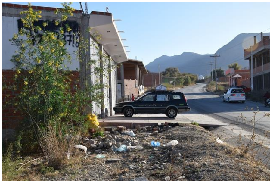
Figura 6: Falta de acessibilidade peatonal e segurança vial.