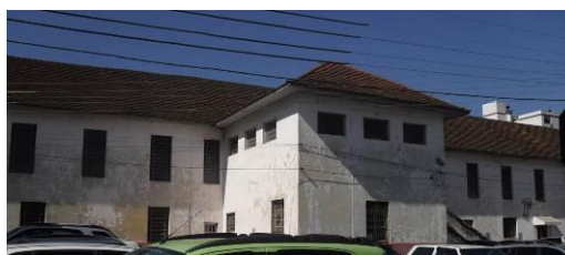
Figura 2: Volumetria edilícia do antigo Quartel