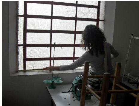
Figura 3: Realização de levantamento métrico pela equipe

Verificou-se que o deslocamento intermunicipal (Erechim-Passo Fundo), a grande área das edificações, a compartimentação interna e o intenso uso atual das edificações foram fatores que dificultaram a execução dos levantamentos, com restrição de horários de entrada em salas e bloqueio de acesso interno (ver figura 3).